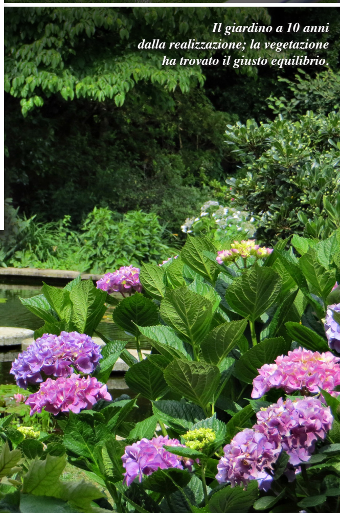
Il giardino a 10 anni dalla realizzazione; la vegetazione ha trovato il giusto equilibrio.