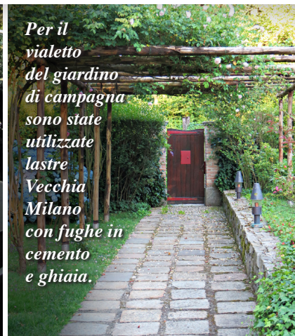
Per il vialetto del giardino di campagna sono state utilizzate lastre Vecchia Milano con fughe in cemento e ghiaia.