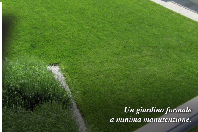
Un giardino formale a minima manutenzione.

Vale quindi la pena investire in arredi e materiali per rendere il nostro giardino ancora più bello?