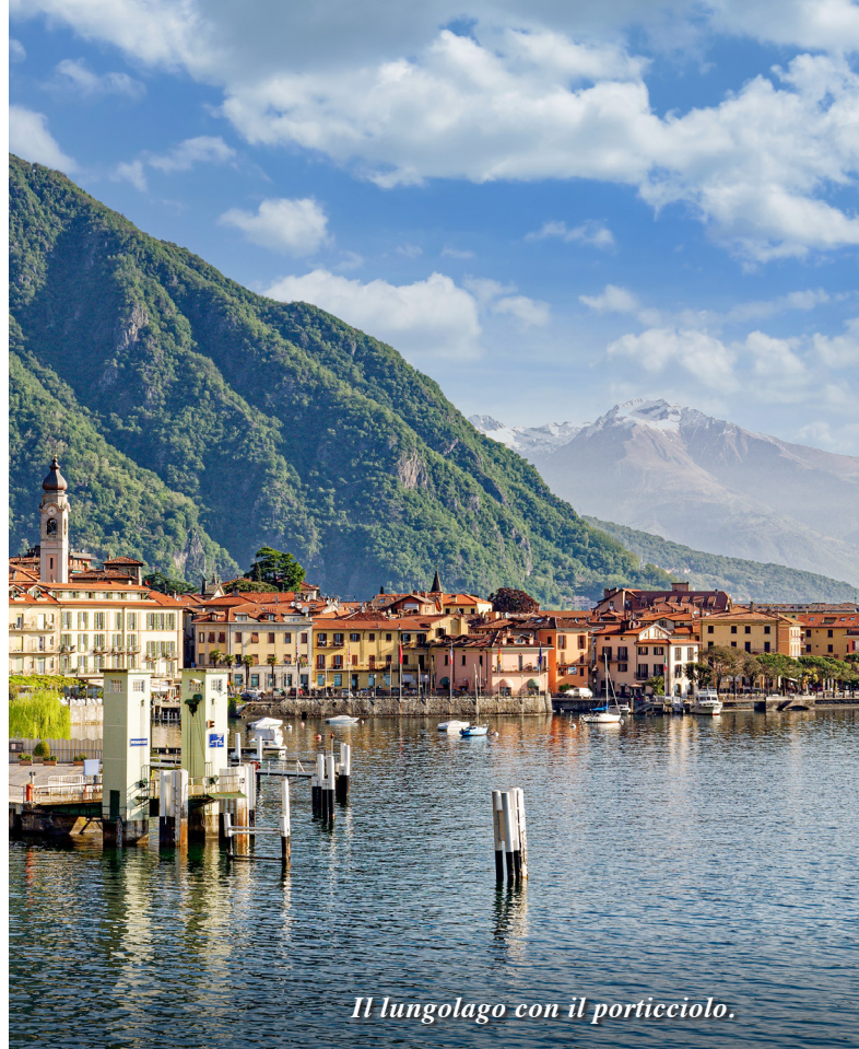
Il lungolago con il porticciolo.

SPORT In collina, con vista sul Lago di Como, il Golf Club Menaggio&Cadenabbia ( www.golfclubmenaggio.com ) è il secondo golf più antico d'Italia : fondato nel 1907 da quattro gentiluomini inglesi, capeggiati dal banchiere Henry John Mylius, nel 1961 diventa di proprietà italiana. Offre un percorso di 18 buche , una Club House unica che sembra un antico circolo londinese, e una biblioteca che ospita 1200 volumi sul golf. Ma non è il golf l'unico sport offerto dalla località: gite in bicicletta sul percorso dell'ex ferrovia Menaggio Porlezza, passeggiate e trekking di tutte le difficoltà sui monti