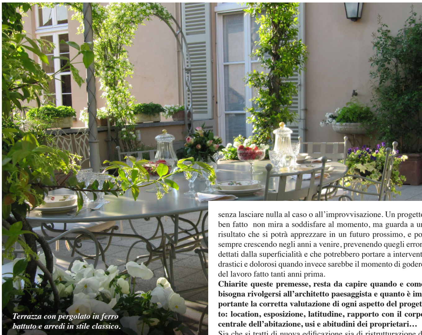
Terrazza con pergolato in ferro battuto e arredi in stile classico.

senza lasciare nulla al caso o all'improvvisazione. Un progetto ben fatto non mira a soddisfare al momento, ma guarda a un risultato che si potrà apprezzare in un futuro prossimo, e poi sempre crescendo negli anni a venire, prevenendo quegli errori dettati dalla superficialità e che potrebbero portare a interventi drastici e dolorosi quando invece sarebbe il momento di godere del lavoro fatto tanti anni prima.