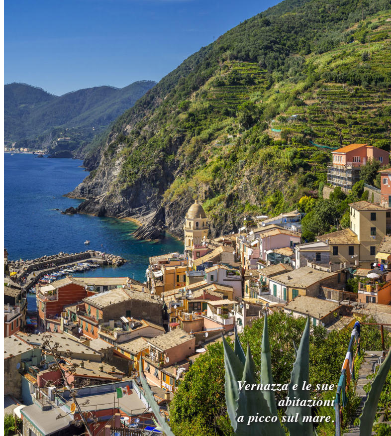
Vernazza e le sue abitazioni a picco sul mare.

GREEN Il Parco Nazionale delle Cinque Terre ( www.parconazionale5terre.it ), sito dell'Unesco, offre itinerari escursionistici su sentieri di diverse difficoltà, con panorami mozzafiato che si alternano a santuari e centri di accoglienza. L' Area Marina Protetta ( www.parconazionale5terre.it/area-marina-protetta.php ) vanta una ricchezza straordinaria di specie animali e vegetali: il suo scopo è di tutelare e valorizzare le caratteristiche naturali e della biodiversità marina e costiera, anche e soprattutto attraverso interventi di recupero ambientale, con la collaborazione del mondo accademico e scientifico. Per visitare entrambi, è necessario un permesso.