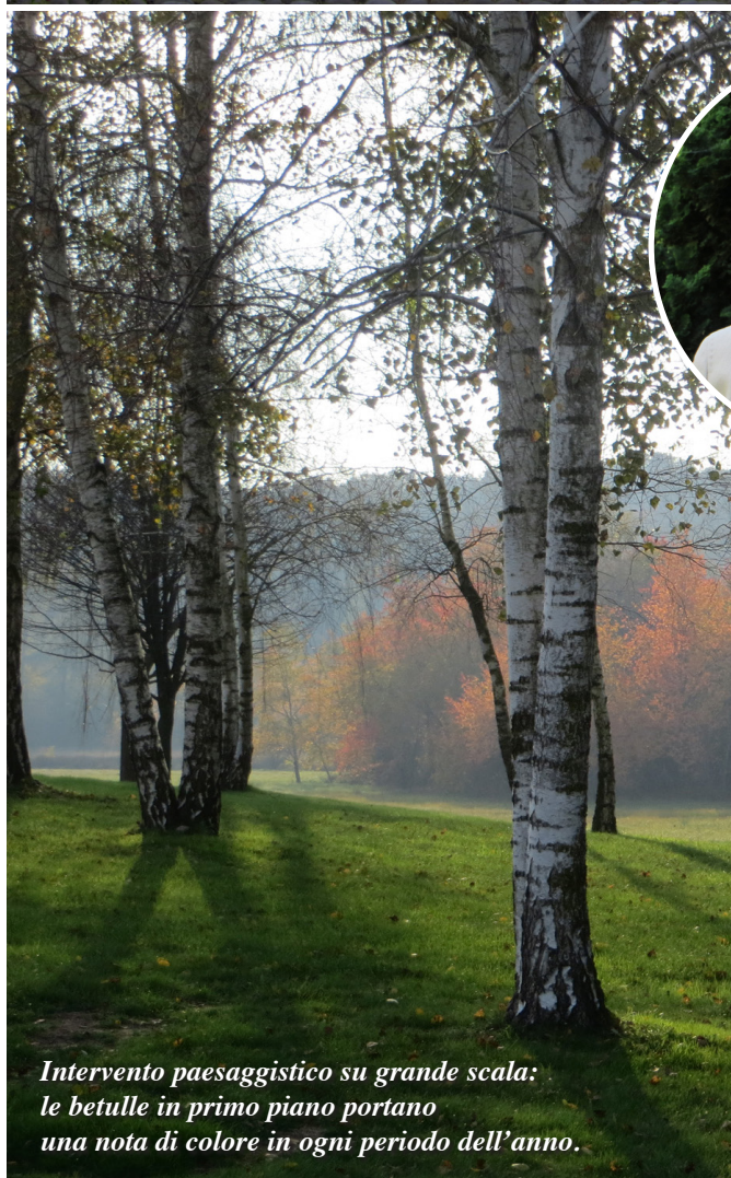
Intervento paesaggistico su grande scala: le betulle in primo piano portano una nota di colore in ogni periodo dell'anno.

Sui materiali non si discute. Una brutta pavimentazione, e dico brutta, non povera, vanifica in partenza ogni sforzo progettuale. Investire su un materiale che non dà garanzie di tenuta nel tempo è pari a buttare denaro. Gli arredi invece completano il progetto e sono elementi decorativi tanto importanti quanto le piante e l'illuminazione. Naturalmente si devono abbinare allo stile del giardino e del terrazzo e devono essere adatti a stare all'aperto, al sole o sotto la pioggia. Oggi i mobili da outdoor sono molto più curati dal punto di vista estetico, ma occorre valutare anche la loro resistenza perché, anche se fosse possibile ritirarli in inverno, un giardino e soprattutto una terrazza così spogliati dai loro arredi mettono davvero tristezza!