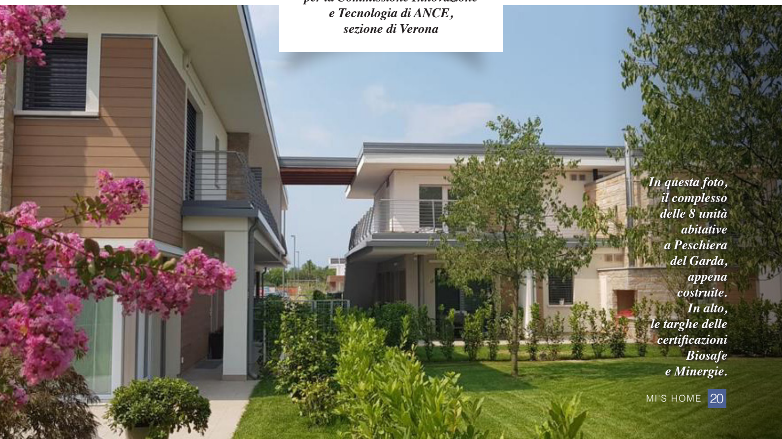
In questa foto, il complesso delle 8 unità abitative a Peschiera del Garda, appena costruite. In alto, le targhe delle certificazioni Biosafe e Minergie.