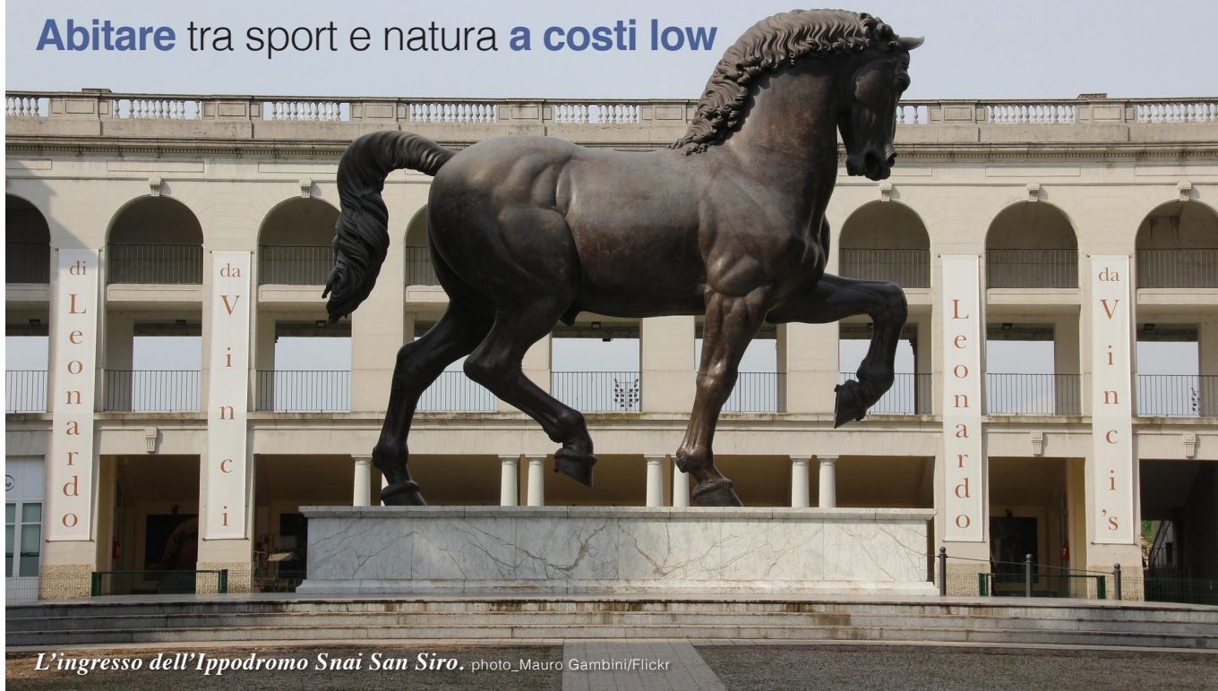
L'ingresso dell'Ippodromo Snai San Siro.

Una zona a sé, nata sulle spoglie del piccolo villaggio agricolo sulle rive del fiume Olona che ha abitato questo territorio fino al 1800 e il cui centro era l'attuale piazzale Lotto. Negli anni '20 la costruzione dello stadio di San Siro e dell'Ippodromo, e negli anni '60 del Palalido ha trasformato il quartiere in cittadella dello sport, con grandi aree verdi che dagli anni '70 hanno attirato nuovi abitanti dal centro. Infatti, da quel periodo, la zona inizia a popolarsi di ville e palazzetti borghesi, fatti edificare da chi, non volendo trasferirsi fuori Milano, preferisce comunque un modo di vivere meno caotico, più tranquillo, che dia l'idea di stare in campagna. Inoltre, con il passare degli anni i collegamenti con il centro della metropoli si sono moltiplicati, mentre la vicinanza con le autostrade è sempre stato un plus. Oggi queste caratteristiche continuano a essere apprezzate, in più, i nuovi poli di City Life e del Portello e la riqualificazione della zona in tema di sicurezza, di sport e di aree green hanno fatto nascere un nuovo interesse soprattutto da parte dei giovani, che avranno come vicini attori, registi e calciatori che abitano qui da tempo.