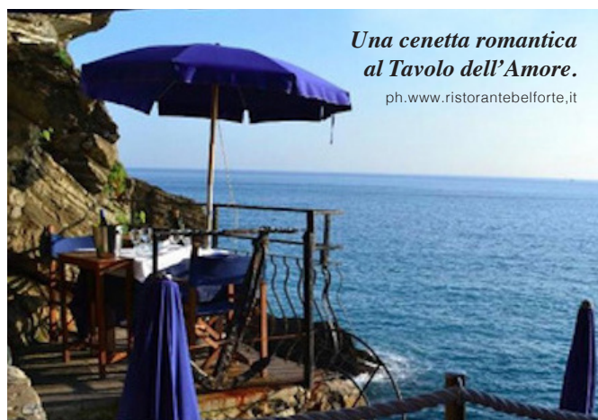
Una cenetta romantica al Tavolo dell'Amore.

FOOD&WINE Un po' in alto, con vista sul mare e il porticciolo di Vernazza, Belforte ( www.ristorantebelforte.it ) offre una cucina di mare tipicamente ligure , con qualche piatto della tradizione come le trofie al pesto, e qualche citazione internazionale come la catalana di crostacei con verdura e frutta. Suggestiva e ampia la terrazza, ma in coppia è bene prenotare il Tavolo dell'Amore , rigorosamente per due: un privé romantico a picco sugli scogli.