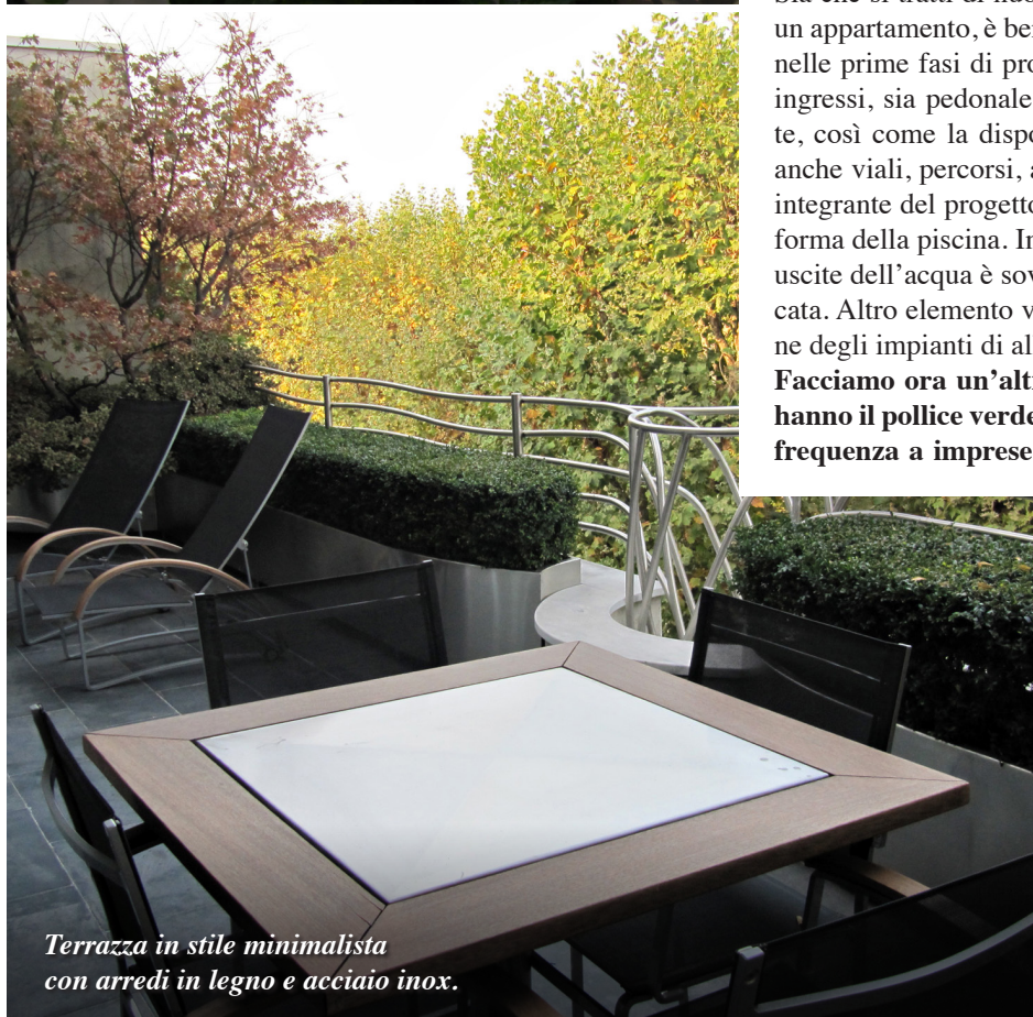
Terrazza in stile minimalista con arredi in legno e acciaio inox.

Facciamo ora un'altra ipotesi: dal momento che non tutti hanno il pollice verde e non possono/vogliono rivolgersi con frequenza a imprese di manutenzione specializzate, pensa