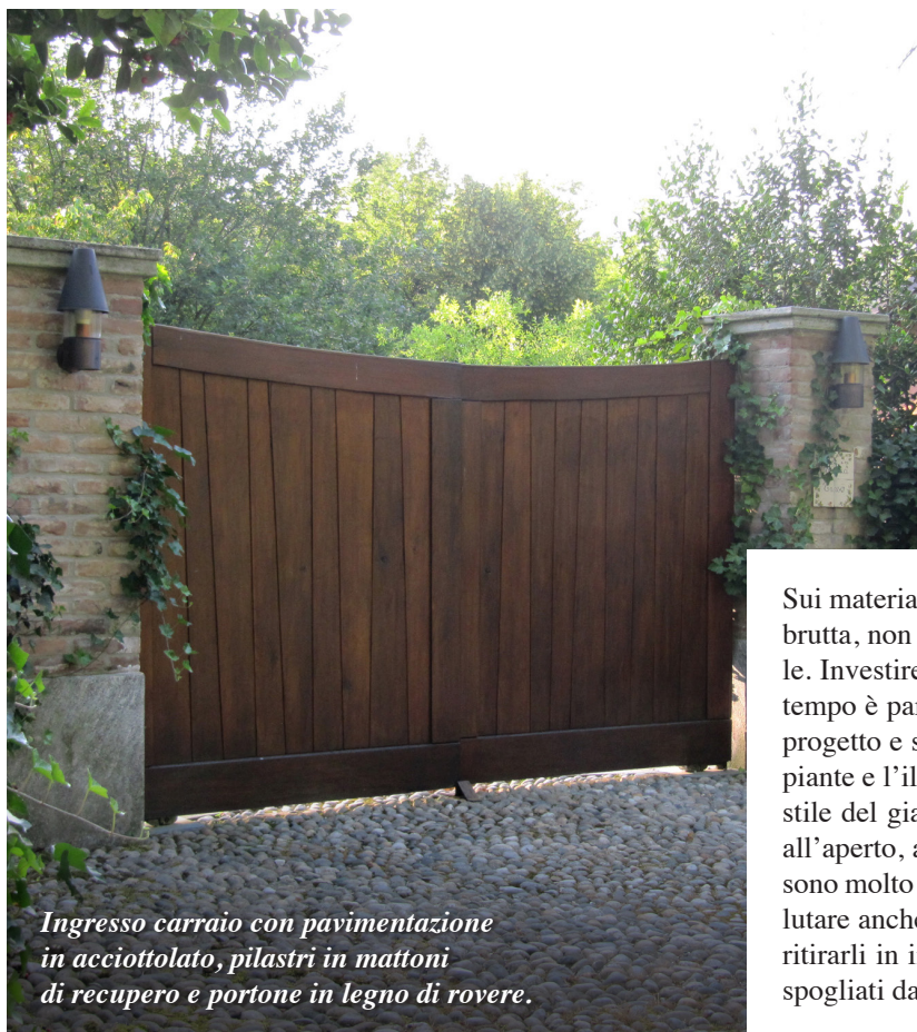
Ingresso carrajo con pavimentazione in acciottolato, pilastri in mattoni di recupero e portone in legno di rovere.