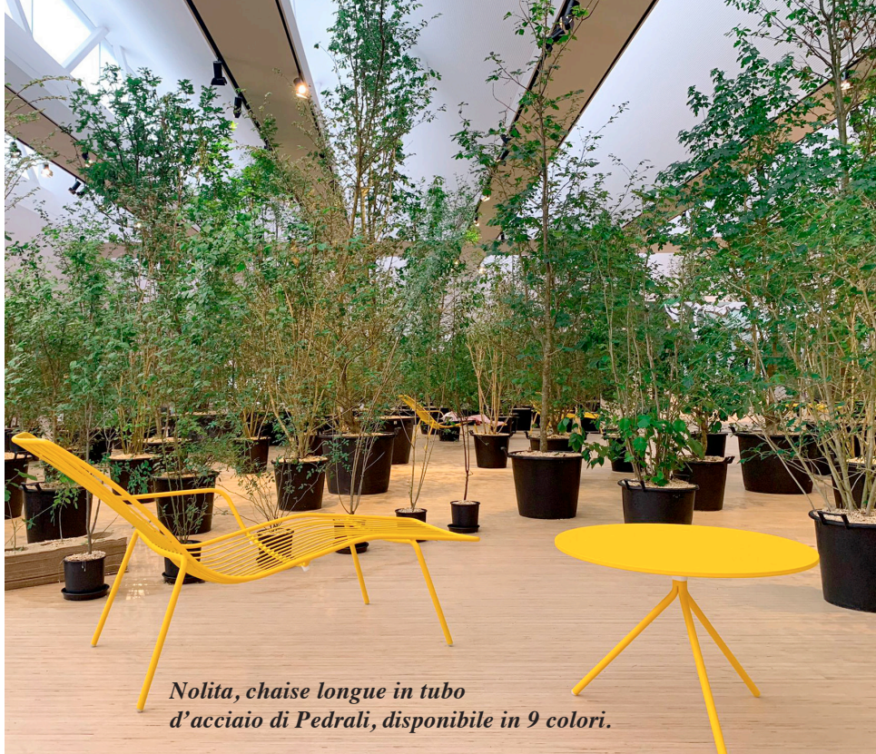
Nolita, chaise longue in tubo d'acciaio di Pedrali, disponibile in 9 colori.

Una comoda seduta all'aria aperta è un piccolo lusso per le giornate estive. Ma come sceglierla? Il trucco è andare controcorrente!